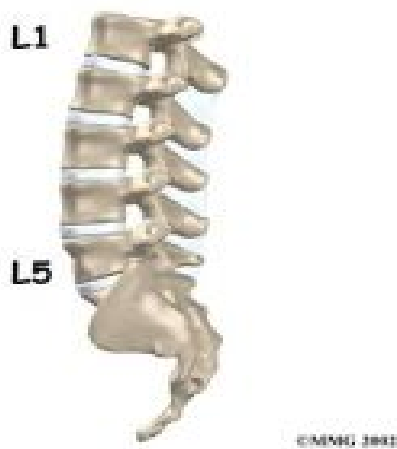
Figuur 1: zij-aanzicht van de lumbale wervelkolom